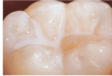
Dan ki gen Mastik

Kisa mastik pou dan yo ye? Mastik pou dan yo se yon ti kouch plastik tou mens yo mete nan fant ki gen sou sifas dan kote ou moulen an sou dan dèyè yo k ap pwoteje dan yo kont kari. Majorite kari dantè timoun ak adolesan yo genyen se sou sifas sa ke yo parèt. Mastik yo pwoteje sifas pou moulen an kont kari dantè yo poutèt li anpeche jèm ak kras manje yo rete kole nan fant yo.